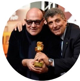
Chi vuole cambiare il mondo