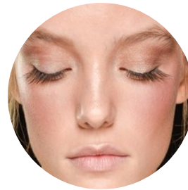
Pelle effetto Bronze