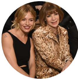
I look in front row