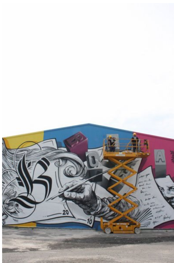
Arti Grafiche Boccia - B - Salerno - Opium, Pencil e Zeus40

La street art usata come mezzo per trasmettere bellezza e armonia all'interno e all'esterno dei luoghi di lavoro. E allo stesso tempo per stimolare creatività e produttività di chi in quei luoghi svolge la sua professione tutti i giorni. Questo è il duplice obiettivo di INWARD Osservatorio sulla Creatività Urbana che ha lanciato #StreetArtFactory per aiutare e coinvolgere le aziende a raccontarsi, a ridisegnare i propri prodotti, a migliorare la propria immagine complessiva proprio grazie alla street art. Un modo insomma di usufruire di una forma d'arte ancora poco conosciuta nel complesso in Italia, soprattutto per quanto riguarda i risvolti economici che porta con sé. Sia in termini di posti di lavoro generati, sia in termini di benefici estetici e rivalutazione economica degli immobili interessati dagli interventi. Le aziende che hanno già scelto di affidarsi alle opere degli street artists sono numerose e tra loro sono presenti anche grandi realtà industriali: da Coca